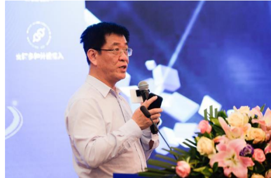
论坛全景 应急管理部安全生产综合协调司副司长赵瑞华